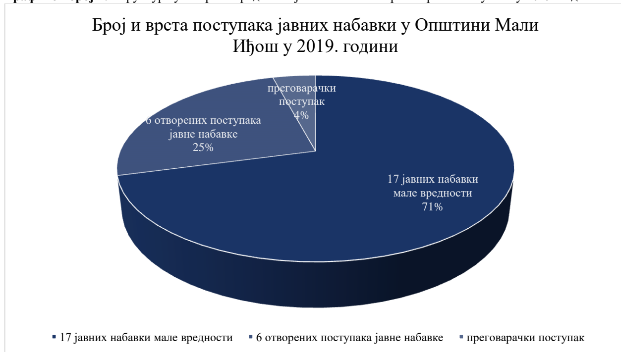
Графикон број 1: Структура уговорене вредности јавних набавки према врсти поступака у 2019. години

Ревизијом је обухваћено укупно девет поступака јавних набавки, од чега је четири спроведено у отвореном поступку, четири у поступку јавне набавке мале вредности и једна преговарачки поступак са објављивањем јавног позива.