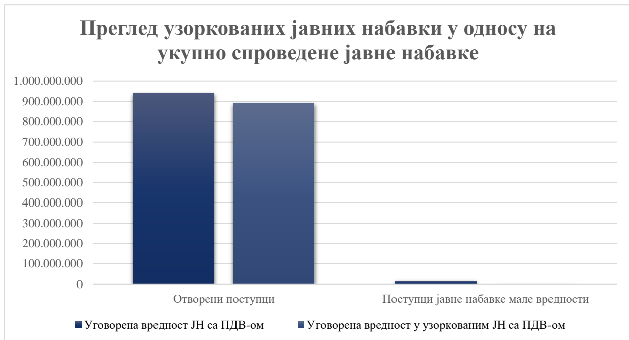
Графикон број 4: Уговорена вредност узоркованих јавних набавки у односу на укупно уговорену вредност јавних набавки у 2020. години

Уговорена вредност у узоркованим поступцима јавних набавки износи 891.025.878 динара са ПДВ-ом, што је 93% укупно уговорене вредности у спроведеним поступцима.